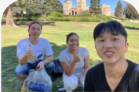
Civil Engineering Senior (토목공학 4학년) / Construction Manager (토목공사매니저)

UCLA에서 경험할 수 있는 동아리와 졸업생 커뮤니티와 같은 다양한 활동들을 통해서 커리어 성취에 대한 기회를 창출함 특히 졸업생 커뮤니티 뿐만 아니라 각 동아리마다 전문가를 배치하여 학생들이 하고자하는 일에 지도를 받을 수 있음.