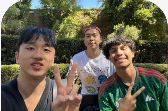
Physiological Science Freshman (생리학 전공 1학년) / sports physiotherapist (스포츠 물리치료사)

커리어를 성취할 수 있도록, 학업에 대한 성취도를 높일 수 있도록 경쟁에 의한 기회를 학교에서 제공