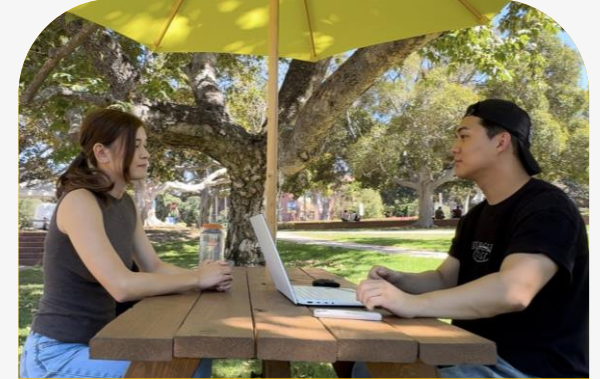
BRITNEY / UC BERKELY 졸업 / ENTERTAINMENT&LAW

COMMUNITY RESOURCE가 잘 구축되어 있는 것을 장점으로 꼽음. 소셜 그룹에서 사교활동과 클럽 활동 등 학생들 간 사교활동을 장려하는 문화가 도움이 됨